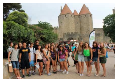
CARCASSONNE - à 1h