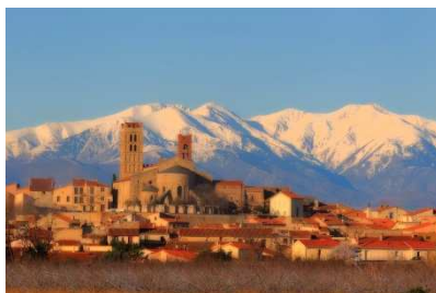
LE MONT CANIGOU