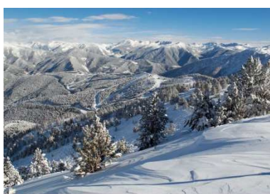
PYRÉNÉES - à 1h de Perpignan