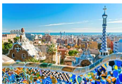
BARCELONE - à 1h10 en TGV